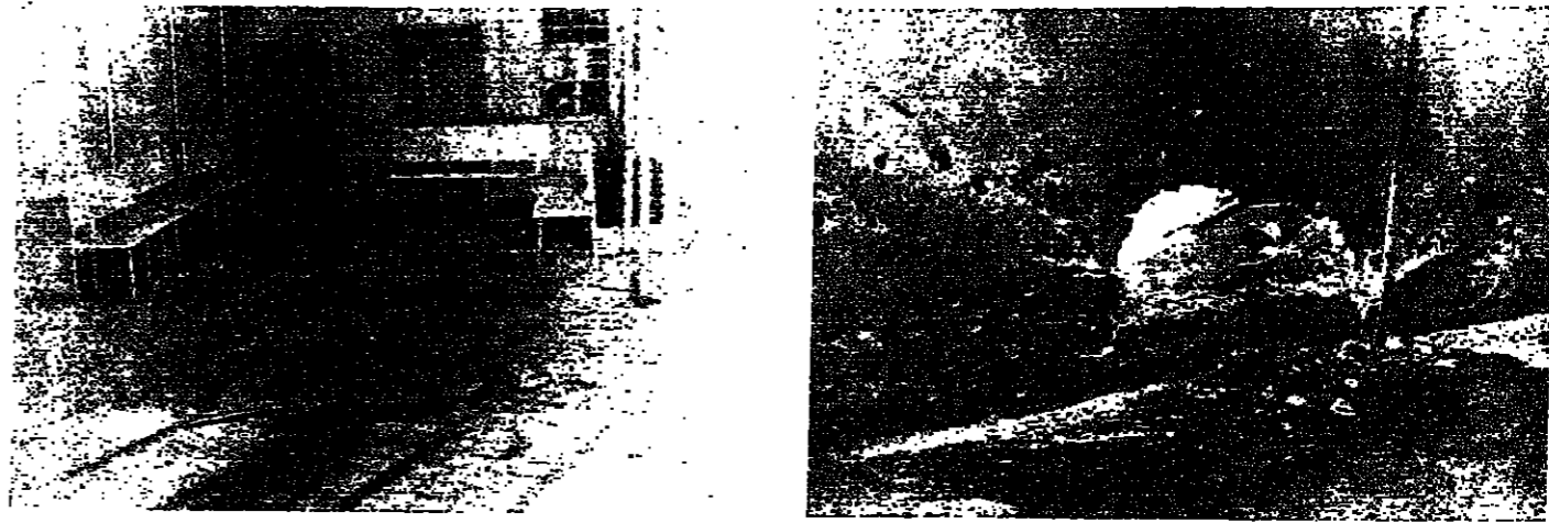
شهدت بيروت ليلة امس الاول وقصف امس اشتباكات عنيفة رافقتها تراشق بمختلف انواع الذخائر والصواريخ، وتركت هذه الاشتباكات بصورة رئيسية بين مناطق سوديك والناصرة وهي السريان في الاشرفية من جهة، وبين شارع البرجاوي ورأس النبع من جهة ثانية. ثم امتدت الى ساحة النيباس وشارع عيشة الخوري ومنطقة ستاركو والقنطاري لتشمّل السوق التجارية بأكملها.